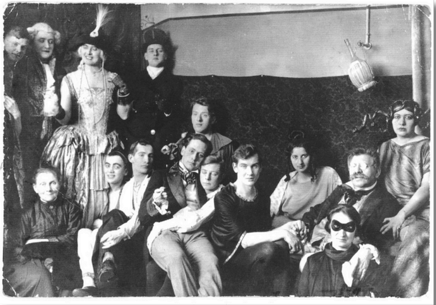
Magnus Hirschfeld (a la derecha con gafas y bigote frondoso, tomado de la mano de su pareja, Karl Giese) en una fiesta de disfraces en el Instituto para la Ciencia Sexual, 1920.

Las posturas de Hirschfeld sobre el género y la sexualidad eran decididamente progresistas, y tuvo que lidiar con el antisemitismo dirigido contra él y su labor. Sin embargo, mantuvo ideas racistas e imperialistas en su trabajo, llegando a menospreciar en ocasiones a personas de color, especialmente a personas negras, incluso mientras se codeaba con destacados escritores y pensadores negros, como el poeta norteamericano Langston Hughes. Más adelante en su vida, la escritura de Hirschfeld se volvió más anticolonialista. Esto quizás se deba a que, después de empezar a viajar por el mundo con Li Shiu Tong, Hirschfeld fue testigo del racismo que Li recibía .